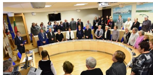
Neringos trečiojo amžiaus universitetas bendruomenės vyresniesiems organizavo paskaitas

Įgyvendinant ES lėšomis finansuojamą projektą „Kompleksinės paslaugos šeimai Neringos savivaldybėje“ buvo vykdomos individualios psichologų konsultacijos, šeimos įgūdžių ugdymo ir stiprinimo veiklos, dvi penkių dienų teminės vaikų vasaros stovyklos ir dvi vienos dienos teminės (sporto) vasaros stovyklos vaikams. Iki 2020-ųjų vyksiančio projekto vertė – 88, 3 tūkst. Eur, projektas finansuojamas 100 % ES lėšomis.