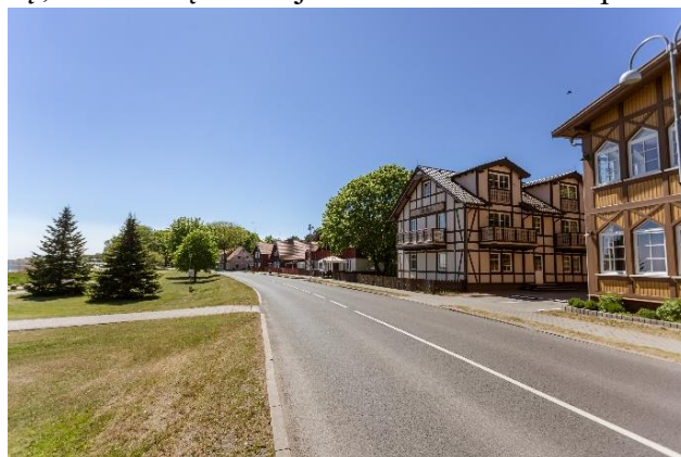
Gyventojų prašymu inicijuotas sektorinio greičio matuoklio įrengimas Juodkrantėje

Nuo praėjusių metų Neringos savivaldybė partnerio teisėmis dalyvauja projekte „Automobilių statymas tampa išmanus“, kuriuo siekiama naudojant pažangius IT sprendimus optimizuoti automobilių statymą, ypač aktualų vasaros sezono laikotarpiu. Visas projekto biudžetas – 2 689,4 tūkst. Eur. Neringos savivaldybei suteikiama parama projekto įgyvendinimui – 195,7 tūkst. Eur (85 proc. išlaidų finansuojama Europos regioninės plėtros fono lėšomis, 15 proc. – savivaldybės biudžeto lėšomis). Planuojamas projekto įgyvendinimo laikotarpis – 3 metai.