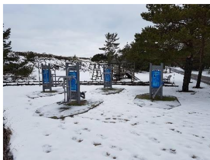
Juodkrantėje – nauja lauko treniruoklių zona