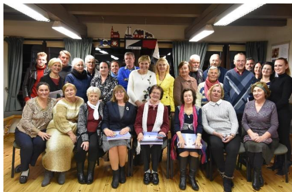
175-ąją Preilos sukaktį minėjo gyvenvietės bendruomenė

Praėjusiais metais paskelbta, kad Neringos savivaldybė patenka į geriausias sąlygas gyventojams užtikrinančių šalies savivaldybių penketuką (Vilniaus politikos analizės instituto sudarytame savivaldybių gerovės indekse užima 5-ąją vietą).