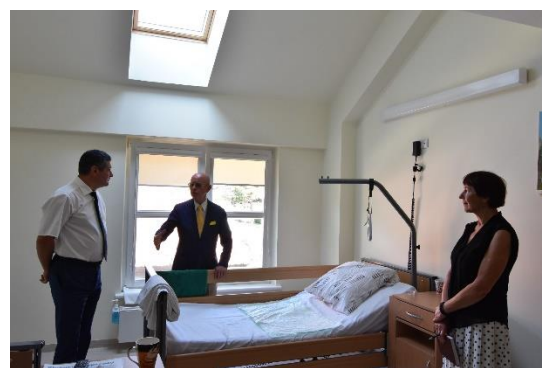
Visus metus veikė Palaikomojo gydymo ir slaugos skyrius

Praėjusiais metais Neringos savivaldybės taryba skyrė ženkliai daugiau lėšų sveikatos priežiūrai.