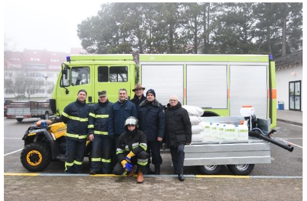
Ir praėjusiais metais dėmesys buvo skiriamas priešgaisrinės saugos užtikrinimui

Savivaldybės kontroliuojamų įmonių (UAB „Neringos energija“, UAB „Neringos komunalininkas“, UAB „Neringos vanduo“) veikla plačiau pristatoma jų metinėse veiklos ataskaitose.