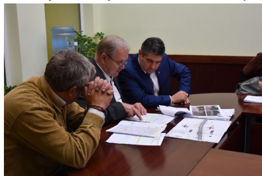
Susisiekimo ministerijoje, Lietuvos automobilių kelių direkcijoje ir Neringos savivaldybėje vyko susitikimai dėl tolimesnės krašto kelio ir dviračių tako rekonstrukcijos

Kultūros ministerijoje dalyvauta susitikimuose dėl lėšų skyrimo Nidos kultūros ir turizmo informacijos centro „Agila“ rekonstrukcijos projekto įgyvendinimui. Dėl žalos už nugriautus pastatus susitikimai vyko Teisingumo ministerijoje, o Vidaus reikalų – dėl skęstančiųjų gelbėjimo Baltijos jūroje. Sveikatos apsaugos ministerijoje susitikimai vyko dėl greitųjų automobilių bei dėl didesnio finansavimo Neringos pirminės sveikatos priežiūros centrui skyrimo.