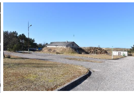
Rengta dokumentacija naujų laisvalaikio erdvių atsiradimui

Rengta dokumentacija naujų laisvalaikio erdvių įrengimui Juodkrantėje. Greta esamo šios gyvenvietės mini golfo aikštyno bus įrengtos naujos lauko šaškių bei šachmatų ir petankės žaidimų aikštelės. Numatyta, kad Juodkrantės pajūrio apsauginio kopagūbrio kaimynystėje bus įrengtos lauko teniso, krepšinio, futbolo aikštelės. Numatomos vietos stalo tenisui, vaikų žaidimo aikštelėms.