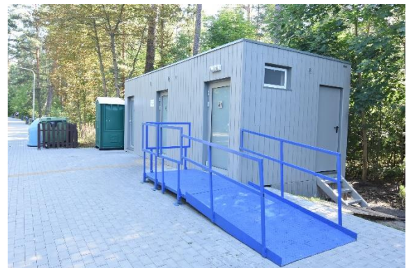
Atnaujinti viešieji tualetai Nidoje ir Juodkrantėje

Atlikti 9 bešeimininkių objektų likvidavimo darbai. Bešeimininkiai statiniai likviduoti įgyvendinant ES lėšomis finansuojamą projektą. Įgyvendinant šį projektą taip pat bus tvarkomas Urbo kalnas, kurio sutvarkymo projektas baigtas rengti praėjusiais metais. 2019-aisiais bus įrengti arba atnaujinami pėsčiųjų ir dviračių takai su dangą, laiptai. Prie tam tikrų takų numatomas papildomas apšvietimas. Kraštovarkinių kirtimų dėka bus atidengti