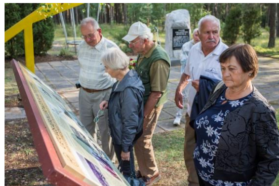
Minint Nidos sklandymo mokyklos 85-metį atnaujintas informacinis stendas bei kelrodės