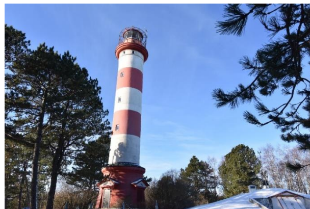
Nidos švyturį planuojama atverti visuomenei