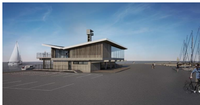
Pradėti Nidos uosto pastato kapitalinio remonto darbai sritimi vystymui. Šių patalpų dėka, išsprendus

Pradėtas įgyvendinti projektas „Juodkrantės terasos“ – atnaujinamas pastatų kompleksas, esantis Kalno g. 32-36. Baigiant rengti Nidos Šiaurinės Purvynės gatvės teritorijos detalų planą, verslas jau braižo vizijas, kurios bus įgyvendinamos buvusioje komunalinėje ūkinėje zonoje.