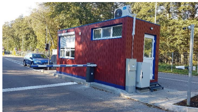
Į naują vietą iškeltas Nidos kontrolės postas

Rinkliava už įvažiavimą į Neringą. Nuo liepos 3-osios autobusams virš 30 vietų didėjo įvažiavimo į Neringą rinkliavos dydis , taikomas vasaros sezono metu. Nuo birželio 1-osios iki rugpjūčio 31-osios šiai transporto priemonių grupei taikomas dydis didėjo nuo 45 eurų iki 70 eurų . Sprendimas priimtas įvertinus tai, kad nuo birželio 1-osios įsigaliojus naujoms AB „Smiltynės perkėla“ teikiamų paslaugų įkainiams, ženkliai sumažėjo autobusų (virš 7 t., virš 30 vietų) persikėlimo keltais kaina. Neringos savivaldybei padidinus vietinę rinkliavą šiai transporto priemonių grupei, atvykimo į Neringą autobusais (virš 30 vietų) kaštai, palyginus su praėjusiais metais, išlieka mažesni. Surinkti pinigai leidžia gerinti kurorto infrastruktūrą.