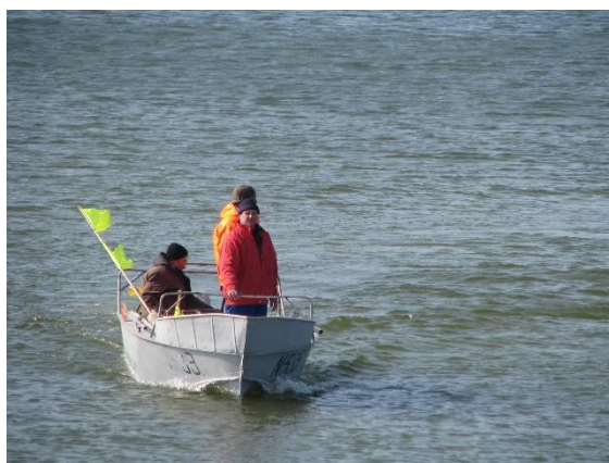
Neringos žvejams – galimybė teikti paraiškas finansavimui gauti

Neringos žuvininkystės regiono vietos veiklos grupės „Vidmarės“ parengtai Neringos žvejybos ir akvakultūros plėtros strategijai 2016–2020 m. skirta visa prašoma paramos suma jos įgyvendinimui – 556 684 Eur. Vietos projektų administravimui skirta 139 171 Eur. Praėjusiais metais Neringos žvejai ir bendruomenės buvo kviečiamos teikti paraiškas vietos projektams įgyvendinti (buvo trys kvietimai). Gautos dvi paraiškos, viena pripažinta tinkanti. Remiamos veiklos: žuvų laimikio pirminis apdirbimas, rinkodara ir (ar) tiesioginė prekyba, turizmo ir kitų paslaugų teikimas (investicijos į laivą, žūklės turizmas, maitinimo ir apgyvendinimo paslaugos, paslaugų žvejams teikimas ir pan.). Kitais metais ir vėl bus skelbiami kvietimai teikti paraiškas, koreguojama strategija, siekiant palengvinti sąlygas gauti finansavimą.