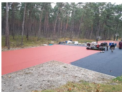
Nidoje – naujos tinklinio ir badmintono aikštelės

Unikalus Kuršių nerijos kraštovaizdis neišdildomų įspūdžių suteikia kiekvienam pusiasalio lankytojui, o plėtojama Neringos laisvalaikio infrastruktūra leidžia juo mėgautis ilsintis aktyviai. Tęsiant aktyviam laisvalaikiui skirtos infrastruktūros vystymą, 2018-aisiais įrengtos dvi viešos tinklinio ir badmintono aikštelės (greta Neringos gimnazijos), nauja lauko treniruoklių zona (greta Juodkrantės pajūrio (UAB „Jūros būstas“ dovana).