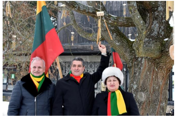
Parėjusiais metais Neringoje vyko renginiai ir iniciatyvos skirtos Valstybės šimtmečiui.

Praėjusiais metais atidengta skulptūra „Prieš vėją“, vaizduojanti per kopas žengiantį Žaną Polį Sartą (skulptorius Klaudijus Pūdimas). Skulptūra atidengta rašytojo gimimo dieną – birželio 21-ąją. Rudenį atidengta skulptūrinė kompozicija-suoliukas „Paukštis“, skirtas prancūzų karių, prisidėjusių prie Kuršių nerijos kraštovaizdžio formavimo, atminimui (skulptorius Kęstutis