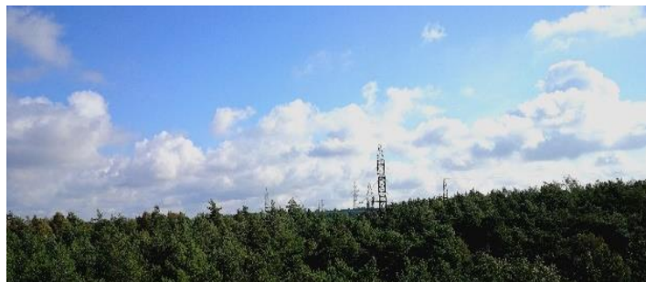
Pradėtas įgyvendinti Kuršių nerijos elektros tinklų pertvarkymo projektas

ESO pradėjo įgyvendinti Kuršių nerijos elektros tinklų pertvarkymo projektą. Elektros oro linijos Kuršių nerijoje bus pakeistos požeminėmis kabelių linijomis. Tai leis reikšmingai padidinti elektros tiekimo patikimumą ir pagerinti saugomos teritorijos kraštovaizdį.