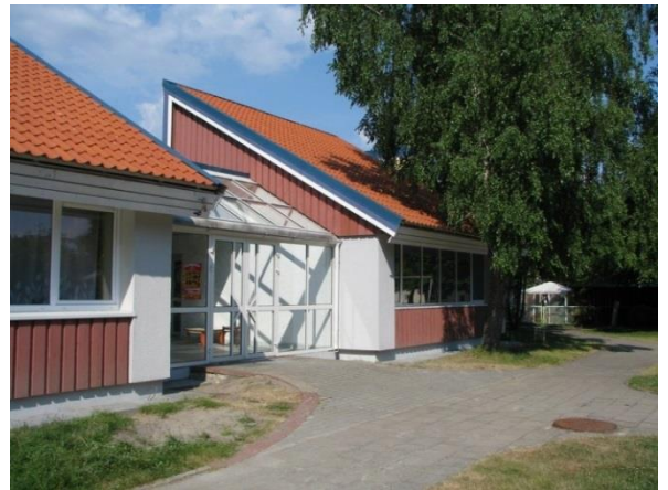
Daug diskutuota apie Juodkrantės darželio pastato pritaikymą kitoms edukacinėms, kultūrinėms ar socialinėms reikmėms

Praėjusiais metais kartu su Juodkrantės bendruomene daug diskutuota dėl šios gyvenvietės švietimo įstaigų patalpų pritaikymo kitoms edukacinėms, kultūrinėms ar socialinėms reikmėms. Buvo atliktas Juodkrantės darželio pastato (Ievos Kalno g. 9) energijos vartojimo auditas, parengti projektiniai pasiūlymai ir investicijų projektas, siekiant rekonstruoti pastatą. Neringos savivaldybės mero potvarkiu buvo sudaryta darbo grupė dėl šio pastato rekonstravimo arba einamojo remonto bei galimų veiklų vykdymo, kuri pateikė rekomendacijas.