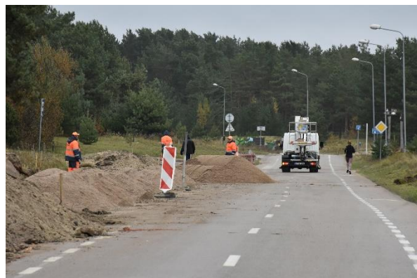
Purvynės gatvės rekonstrukcijos metu nutiesta dviračių juosta išilies į Europos dviračių takų tinklą

Įgyvendintas Purvynės g. važiuojamosios dalies ruožo ir privažiavimų prie garažų su buitinėmis patalpomis rekonstravimo ir statybos projektas.