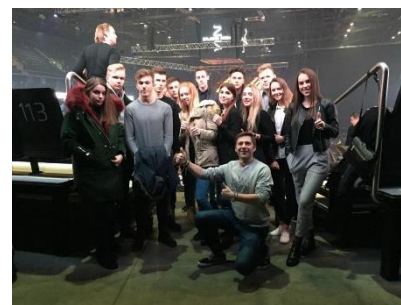
Jaunimo centre kasdien lankėsi vidutiniškai 17 jaunuolių