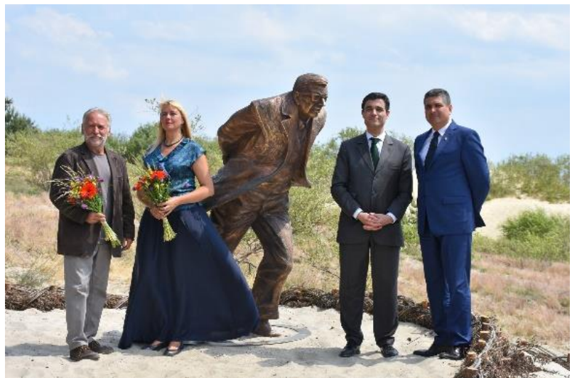
Atidengta skulptūra „Prieš vėją“