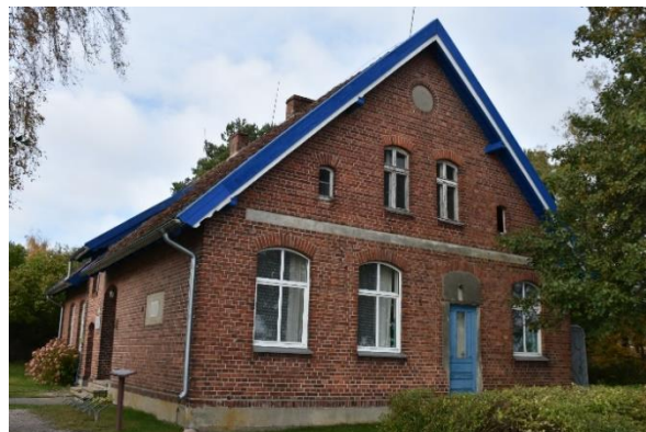
Gautas statybą leidžiantis dokumentas, numatantis Preilos mokyklos pastato kapitalinį remontą

Talka organizuota Alksnynės gynybiniame komplekse.