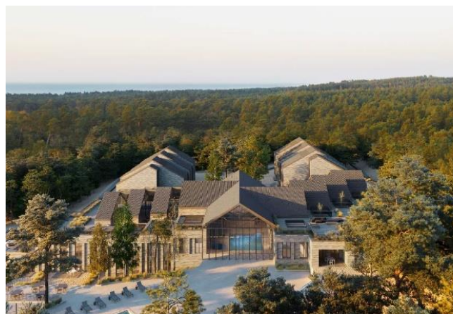
Įgyvendinama poilsio namų „Linėja“ rekonstrukcija leis teikti paslaugas, sprendžiančias sezoniškumo problemas