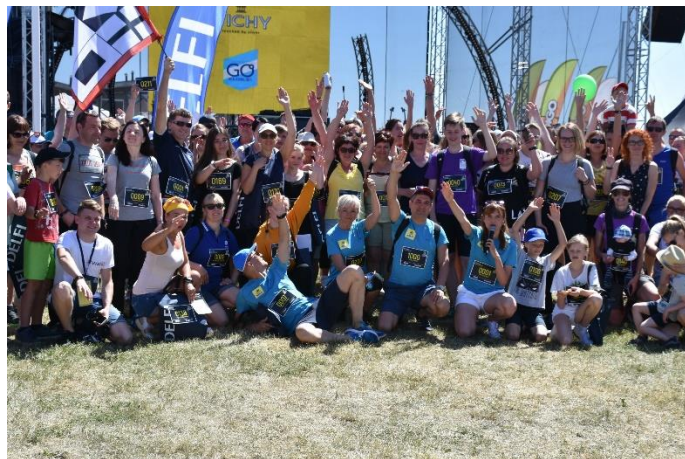
Praėjusiais metais Neringa sulaukė daugiau lankytojų tiek žiemos, tiek vasaros mėnesiais

Ypatingas dėmesys skirtas ir kitoms rinkodaros priemonėms. Kartu su Klaipėdos regiono bei Birštono savivaldybėmis Neringa įgyvendino ES lėšomis finansuojamus projektus, kurių metu