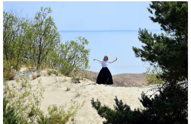
Neringa – Lietuvos kultūros sostinė – 2021-aisiais