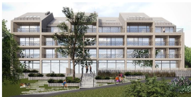
Įgyvendinama poilsio namų „Linėja“ rekonstrukcija leis teikti paslaugas, sprendžiančias sezoniškumo problemas