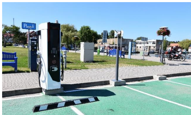
Atlikti veiksmai plėtojant elektromobiliams skirtą infrastruktūrą

Inicijuotas dviejų didelės galios elektromobilių įkrovimo stotelių įrengimas – po vieną Nidoje (Taikos g. 15) ir Juodkrantėje (greta priplaukos automobilių stovėjimo aikštelės). Kiekvienoje stotelėje bus galima įkrauti po du automobilius. Šios infrastruktūros įrengimas finansuojamas projekto „Elektromobilių įkrovimo infrastruktūros plėtra Neringoje“ lėšomis, kurio vertė – 57,8 tūkst. Eur (85% finansuojama ES).