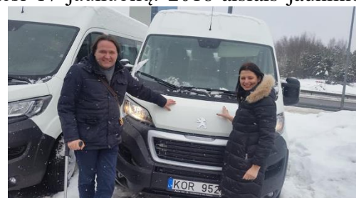
Miesto neįgaliųjų draugijai skirtas automobilis

Daugiau nemokamų paslaugų teikta neringiškių šeimoms.