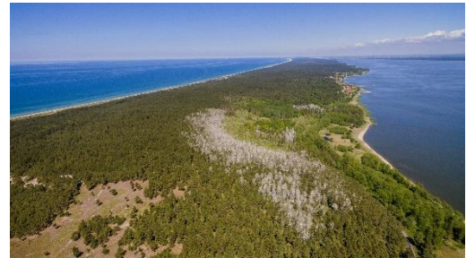
Pradėta kurti neįgaliųjų poreikiams pritaikyta turizmo informacinė infrastruktūra