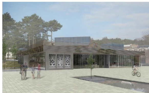
Priimti sprendimai dėl Nidos KTIC „Agila“ pastato rekonstrukcijos