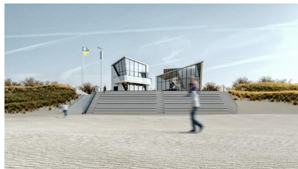
Parengtas Nidos centrinės gelbėjimo stoties sutvarkymo projektas