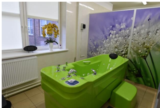
Sveikatos priežiūros centre – daugiau viešųjų paslaugų