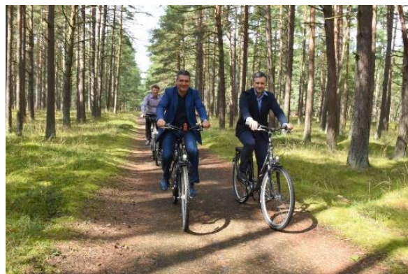
Problemos. Pristatyta būtinybė rekonstruoti dviračių bei pėsčiųjų takus

Savivaldybė dalyvavo teikiant pasiūlymus bei pastabas tolesnei valstybinės reikšmės krašto kelio Smiltynė-Nida rekonstrukcijai (kelį eksploatuoja Lietuvos automobilių kelių direkcija). Būtinybė rekonstruoti per Kuršių neriją einančio dviračių tako atkarpą tarp Smiltynės ir Pervalkos,