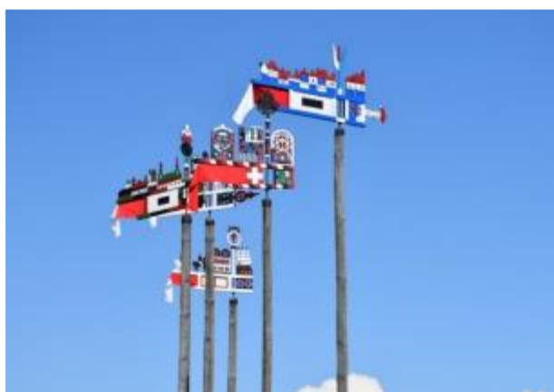
Verslo laisvės indeksas: Neringa pirmoje vietoje, aplenkusi ir šalies didmiesčius

Įsigaliojo dvinarė rinkliava už komunalinių atliekų surinkimą