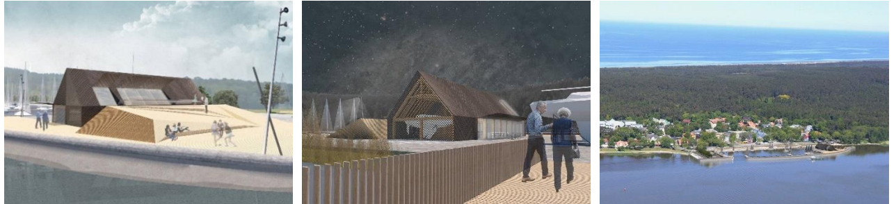
Planai. Išreikštas pritarimas Juodkrantės uosto projektiniams pasiūlymams. G. Janulytės - Bernotienės studijos vizualizacijos

Neringos savivaldybės taryba išreiškė pritarimą Vidaus vandenų keleivinių laivų ir turistinių jachtų uosto Juodkrantėje pristatytiems projektiniams pasiūlymams . Kitas etapas – techninio projekto rengimas, siekiant gauti statybos leidimą. Prieš tai buvo gautas tarptautinės paminklų ir paminklinių vietovių tarybos (ICOMOS) Lietuvos nacionalinio komiteto ekspertinis vertinimas, patvirtinantis, kad šis objektas ne tik kad nepažeidžia Kuršių nerijos vertingųjų savybių, o kaip tik turės teigiamos įtakos socialinei, kultūrinei vietovės aplinkai.