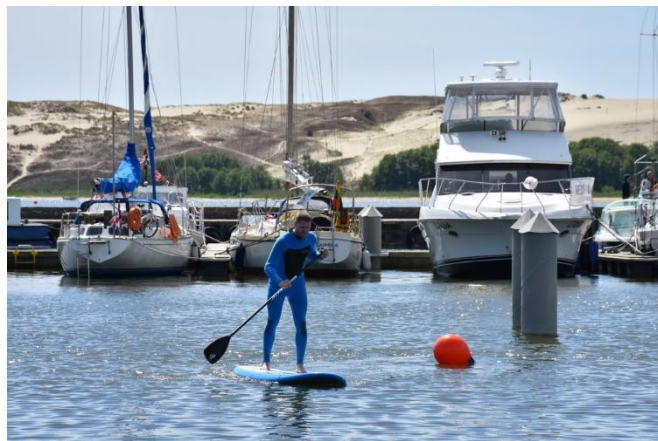
Laisvalaikis. Kurorto gyventojai ir svečiai kviečiami ilsėtis aktyviai

Aukštus sporto rezultatus praėjusiais metais pelniusius septynis neringiškius Neringos savivaldybė paskatino piniginiiais prizais.