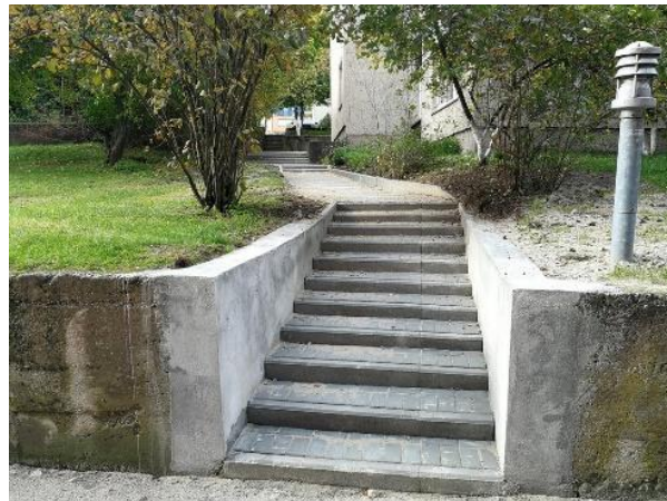
Viešos erdvės. Atlikti smulkūs, bet svarbūs infrastruktūros tvarkybos darbai.

Sėkmingai įgyvendinti Neringos gyventojų pateikti siūlymai miesto infrastruktūros tvarkymo klausimais. Atsižvelgiant į gyventojų pateiktus pastebėjimus, sutvarkyti ištrupėję laiptai, praplatintas praėjimo takas, einantis nuo Taikos g. 20 iki Taikos g. 14 namo Nidoje, kur būtina įrengti porankius. Įgyvendinti tako, prasidedančio ties Nidos degaline ir vedančio į moterų pliažą tvarkybos darbai. Sutvarkytas L. Rėzos gatvės šaligatvis, einantis priešais viešbutį „Vila Flora“ bei lietaus nubėgimo sistema. Planuojama sutvarkyti greta esančią aikštelę, perkelti į ją centrinę gyvenvietės autobusų stotelę (parengta stotelės detaliojo plano korektūra pateikta derinimui).