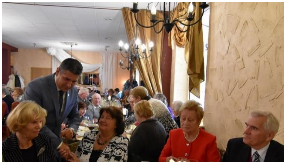
Senjorai. Neringos vyresnieji laisvalaikį buvo kviečiami leisti aktyviai

Dėmesys žmogui – visuomenės poreikį tenkinanti socialinės paramos sistema. Pagrindiniai socialinių paslaugų gavėjai Neringos savivaldybėje išlieka asmenys su negalia ir pensinio amžiaus asmenys. Neringos savivaldybėje socialines paslaugas teikia Neringos socialinių paslaugų centras, VšĮ vaikų globos namai „Aušros žvaigždė“, Neringos miesto neįgalųjų draugija. Socialinės globos paslaugos perkamos kitose savivaldybėse esančiuose socialinės globos įstaigose.