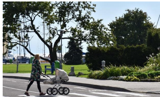
Šeimos. Neringos šeimoms buvo siūloma daugiau paslaugų

Neringos socialinių paslaugų centras yra orientuotas į visas tikslines grupes ir jam praėjusiais metais skirta 149,6 tūkst. Eur savivaldybės biudžeto lėšų (2016-aisiais – 117,3 tūkst. Eur).