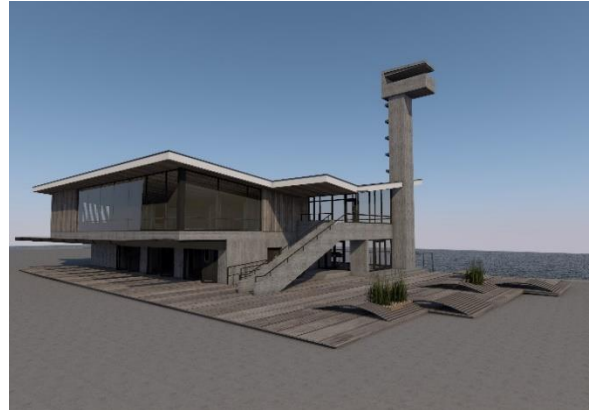
Procesas. Numatomi prieplaukos pastato remonto darbai. UAB „G.A.L. architektai“ vizualizacija.

Gruodžio mėnesį duris atvėrė renovuotas Neringos policijos komisariato pastatas . Nuo praėjusių metų kurorto gyventojų ir svečių patogumui Neringos policija dirba išorėje ir viduje pertvarkytose šiltesnėse, energiją tausojančiose patalpose. Komisariato patalpose įrengta sporto salė.