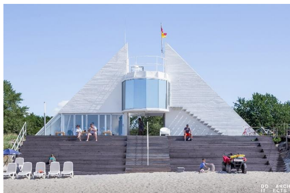
Vasaros naujiena. Kurorto gyventojai ir svečiai ypatingai gerai įvertino Preilos gelbėjimo stoties pokyčius

Lietuvos Respublikos Vyriausybės nutarimu Neringos savivaldybei patikėjimo teise perduotas nekilnojamasis turtas valstybinei funkcijai (valstybės perduotai savivaldybėms) įgyvendinti . Savivaldybei perduotas valstybės nuosavybės teise priklausantis ir Valstybės sienos apsaugos tarnybos