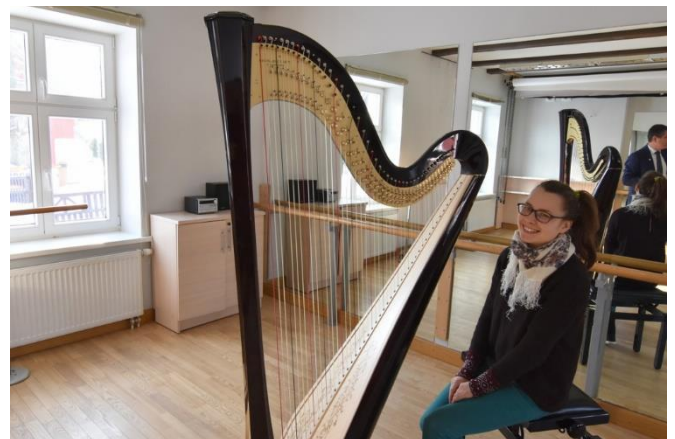
Muzika. Neringos meno mokyklai skirta lėšų arfai įsigyti