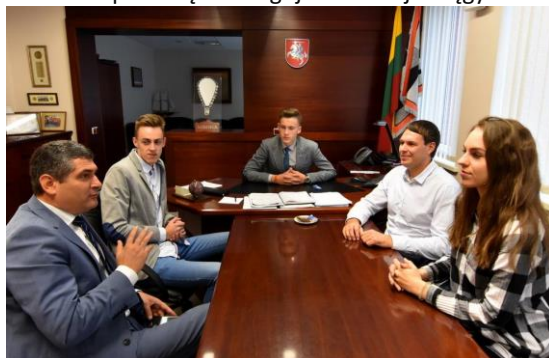
Eksperimentas. Savivaldybės vadovų kėdėse – jaunimas

Vietos savivaldos dienos proga Neringos savivaldybės vadovų kėdės užėmė Neringos jaunimo apskritojo stalo „NAJS“ nariai. Visi trys jaunimo atstovai – Neringos gimnazijos gimnazistai, kartu su savivaldybės vadovais nusprendė, kad rekonstruojant jaunimo „Lofto“ patalpas, jo veikla laikinai turėtų būti perkelta į Neringos gimnazijos erdves (šį sprendimą planuojama įgyvendinti jau 2018-aisiais).