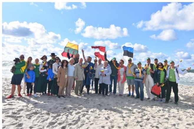
Bendruomeniškumas. Neringos bendruomenės nariai ir jos svečiai Baltijos kelio dienos minėjime

Savivaldybėje nuolat siekiama užtikrinti kokybiškų ir prieinamų paslaugų teikimą, su mokiniais ir jaunimu dirba aukštos kvalifikacijos,