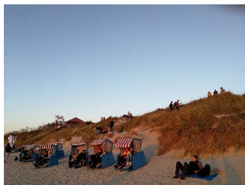
Maloni staigmena. Vokietijos kino kūrėjų dovanoti krėslai netruko išpopuliarėto