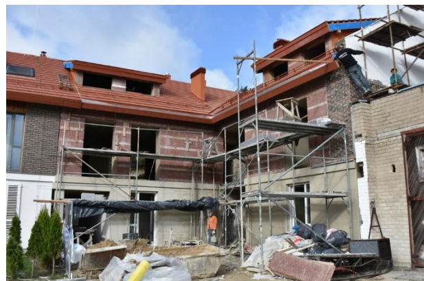
Prioritetai. Savivaldybė siekia spręsti gyvenamojo būsto problemas

Kuriama patraukli aplinka gyvenimui ir poilsiui. Aktuali išlieka gyvenamojo būsto problema – jaunos šeimos nėra pajėgios įsigyti būstą Neringoje, be to, čia faktiškai neegzistuoja ilgalaikė komercinė būsto nuomos rinka. Dėl šių priežasčių susiduriama ir su specialistų stokos problema. Prieš kelis metus Nidos Purvynės gatvėje įgyvendintos gyvenamojo būsto statybos tik iš dalies patenkino tokio būsto poreikį. Siekdama pokyčių šioje srityje, savivaldybė inicijavo net kelis projektus, kuriais sprendžiama gyvenamojo būsto problema.