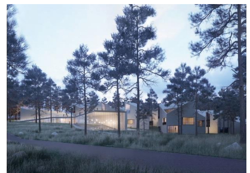
Pirmosios žinios. Projektuojamas kompleksas „Aukšinės kopos“. UAB „Do Architects“ vizualizacija