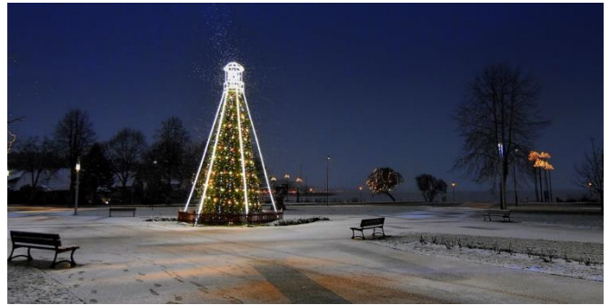
Susitelkimas. Bendruomeniškumo pavyzdys – Nidos eglės puošyba