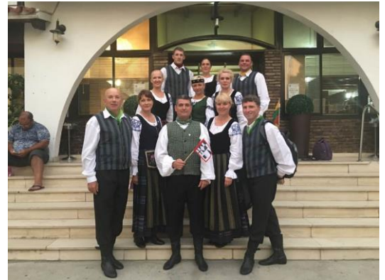
Pristatymas. Neringa pristatyta Kipre vykusiame Viduržemio jūros folkloro šokio festivalyje

Kviečiame sekti Neringos savivaldybės naujienas savivaldybės internetinėje svetainėje www.neringa.lt , Socialinio tinklo „Facebook“ Neringos savivaldybės paskyroje.