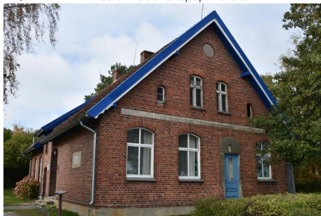
Paveldas. Siekiama atlikti pastato, kuriame šiuo metu yra biblioteka, kapitalinį remontą

Patikėjimo teise perduotas nekilnojamasis turtas