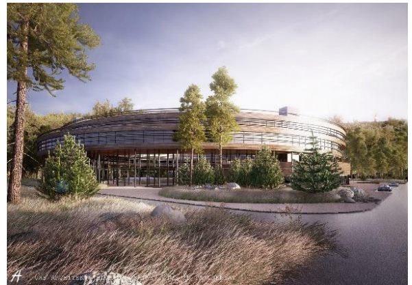
Galimybės. Pristatyta galima Jūros terapijos centro vizija. Studio 3D Architects vizualizacija.