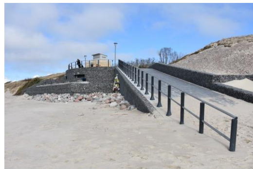
Verslinė žvejyba. Patogesnės sąlygos žvejybai jūroje

Praėjusiais metais patobulinti inžineriniai statiniai, skirti žvejybos laivams nuleisti į Baltijos jūrą ar juos iš jos ištraukti – įrengta motorinių valčių ištraukimo/nuleidimo įranga Nidoje ir Juodkrantėje. Traukimo įrenginiai suteikia galimybę be papildomų priemonių nuleisti/ištraukti valtį iš Baltijos Jūros, kurių masė ne didesnė kaip 3 t. Tai saugiai gali daryti vienas operatorius, o pats procesas trunka ne ilgiau kaip 15 min.