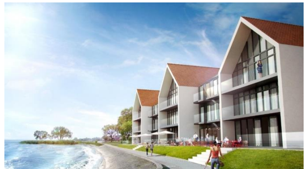
Pokyčiai. Pristatytas „Nidos banga“ rekonstrukcijos projektas. UAB „A TEAM PROJECTS“ vizualizacija.

Remonto darbų laukia Nidos prieplaukos pastatas . Dokumentacija į nekilnojamųjų kultūros vertybių registrą įtraukto pastato sutvarkymui pradėta rengti prieš pusantų metų. Numatoma, kad greta jo galėtų būti įrengta patogi švartavimosi vieta, o pačiame pastate – patalpos laivais atplaukiančių keleivių priėmimui. Čia galėtų būti teikiamos tiek keleiviams, tiek laivo įgulai aktualios paslaugos .