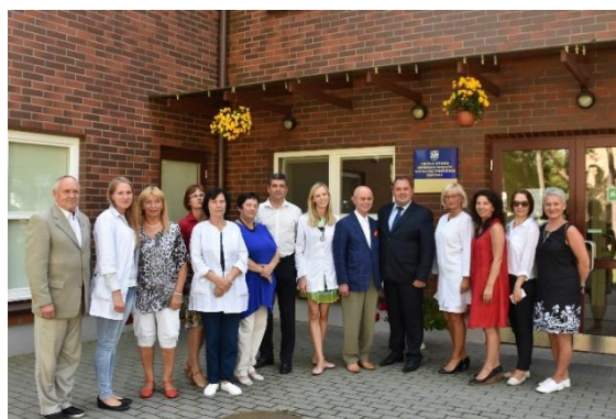
Paslaugos. Neringos pirminės sveikatos priežiūros centras paslaugas pradėjo teikti pilnai rekonstruotose patalpose

2017-aisiais Neringos pirminės sveikatos priežiūros centras pradėjo dirbti pilnai rekonstruotose patalpose, žymiai pagerėjo medikų darbo ir pacientų aptarnavimo sąlygos. Šioje įstaigoje praėjusiais metais buvo prisirašę 1835 asmenys (2016 m. – 1936 asmenys, 2015 m. – 1847 asmenys). Iš savivaldybės biudžeto Neringos pirminės sveikatos priežiūros centrui skirta 61,6 tūkst. Eur, iš jų – Greitosios medicinos pagalbos posto Juodkrantėje išlaikymui – 8,0 tūkst. Eur; fizinės terapijos, rentgeno ir laboratorijos paslaugų teikimui – 5,0 tūkst. Eur, slaugos ir palaikomojo gydymo stacionarių paslaugų plėtrai skirta 43,8 tūkst. Eur, iš dalies finansuotas gydytojo odontologo atlyginimas – 4,0 tūkst. Eur. Ir toliau tęsiamas bendradarbiavimas su Vilniaus Santariškių klinikomis – praėjusiais metais kurorto gyventojus taip pat konsultavo gydytojai specialistai.