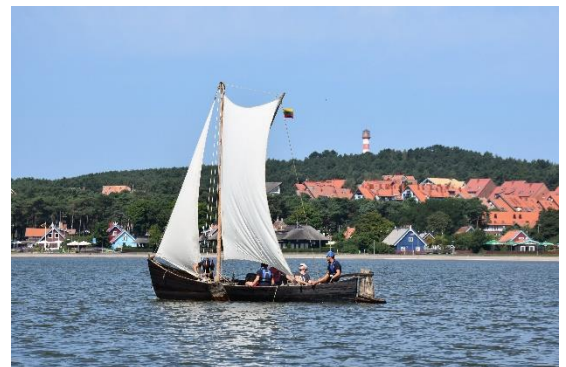
Akcentai. Neringoje kviečiame keliauti damaus turizmo principais – saugant natūralią gamtinę ir kultūrinę aplinką

Savivaldybė dalyvauja septyniuose Europos Sąjungos lėšomis finansuojamuose e-rinkodaros projektuose. Šių projektų akcentas – siekis populiarinti kurortą ir surasti veiksmingų būdų, kaip pritraukti dar daugiau turistų, nes vis svarbesnė tampa internetinė rinkodara.