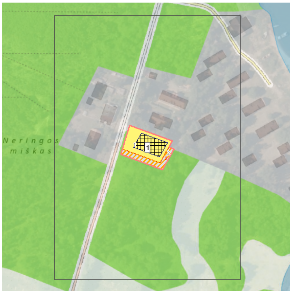
Situacijos schema, lapų išdėstymas