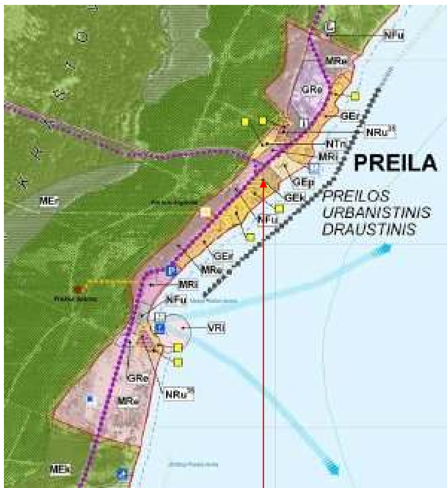
KNNP tvarkymo plano fragmentas.