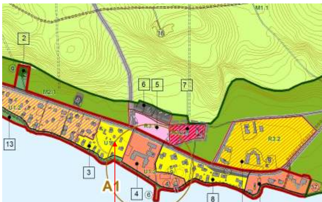
Planuojamos teritorijos vieta.

Numatytas užstatymo aukštingumas: 1 aukštas su mansarda, užstatymo aukštis: gyvenamųjų namų – iki 7,5 m, pagalbinių pastatų (priklausinių) – iki 5,5 m.