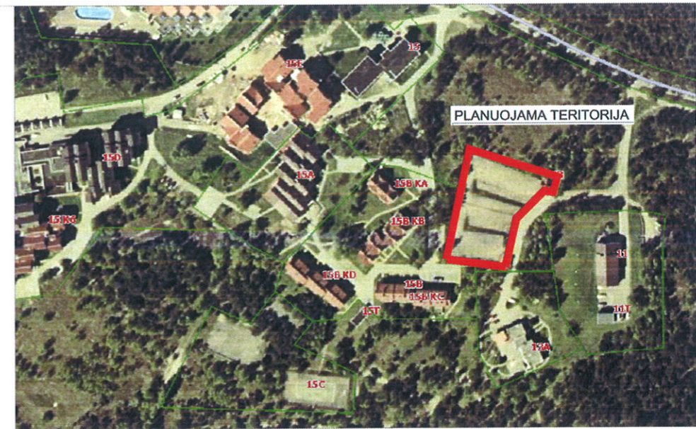
SITUACIJOS SCHEMA SU SKLYPO DISLOKACIJOS VIETA